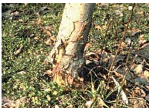
Izgled napadnutog debla jabuke

Pripada redu leptira. Krila su mu prozirna jer ih samo na rubovima pokrivaju ljuščice. Ovi su leptiri štetnici drva jer im gusjenice žive u deblima voćaka ili u granama i izbojima u kojima buše svoje hodnike. Ove godine zabilježen je jači napad ovog štetnika u većem broju voćnjaka u Osječko-baranjskoj županiji.