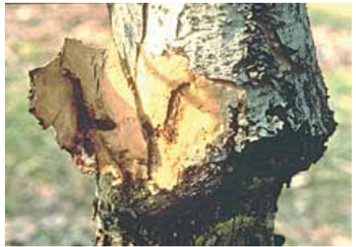
Bušotina gusjenice jabukove staklokrilke ispod kore