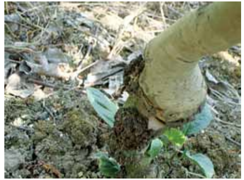
Burr knots-zadebljali dio podloge ispod mjesta cijepljenja

Osnovna mjera zaštite od napada staklokrilke je premazivanje rana nakon rezidbe ili drugih oštećenja. Jedino kombinacijom svih navedenih mjera (hvatanjem leptira pomoću jabučnog soka, premazivanjem rana, kemijskim tretiranjem prskanjem) možemo spriječiti napad jabukove staklokrilke.