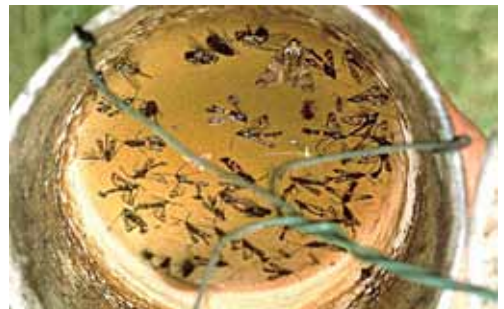
Uhvaćeni leptiri jabukove staklokrilke